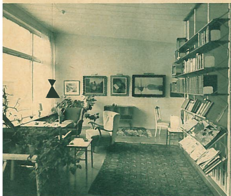
Bokhylla gömmer trappträcket

me vid fönstret och se solen gå ned över Sundet. Rummet ger ett intryck av rymd och luft utan att man därför prutats på kravet på hem-trevnad. Det gracila soffbordet går bra ihop med de färgglada stolarna.