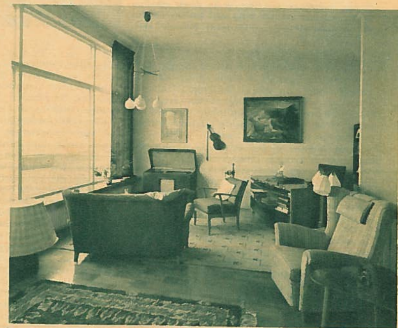
Arbetsplats i vardagsrummet